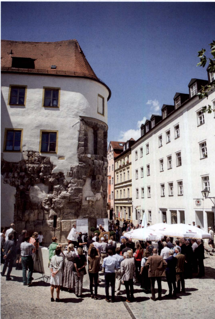
Bischof Dr. Rudolf Voderholzer segnete die Porta Praetoria im Juni 2017 in Anwesenheit aller Beteiligten und zahlreicher Gäste;

Allerdings zeigen zwei übereinander liegende Innenräume des Ostturmes noch das originale, der Außenseite entsprechende Großquadermauerwerk, wengleich dieses innen stellenweise in der Neuzeit ausgeflickt und abgearbeitet wurde. Ebenso ist die innere Geschosseinteilung nicht mehr original. Die Sanierung des Ostturmes in den Jahren 2016 und 2017 ermöglichte die rückseitige Erschließung des oberen Raumes durch eine Glastüre, die den Blick ins Innere freigibt, sowie die Einrichtung einer Informationszentrale für das neue „document Porta Praetoria“. Diese groß angelegte Maßnahme wurde zu zwei Dritteln im