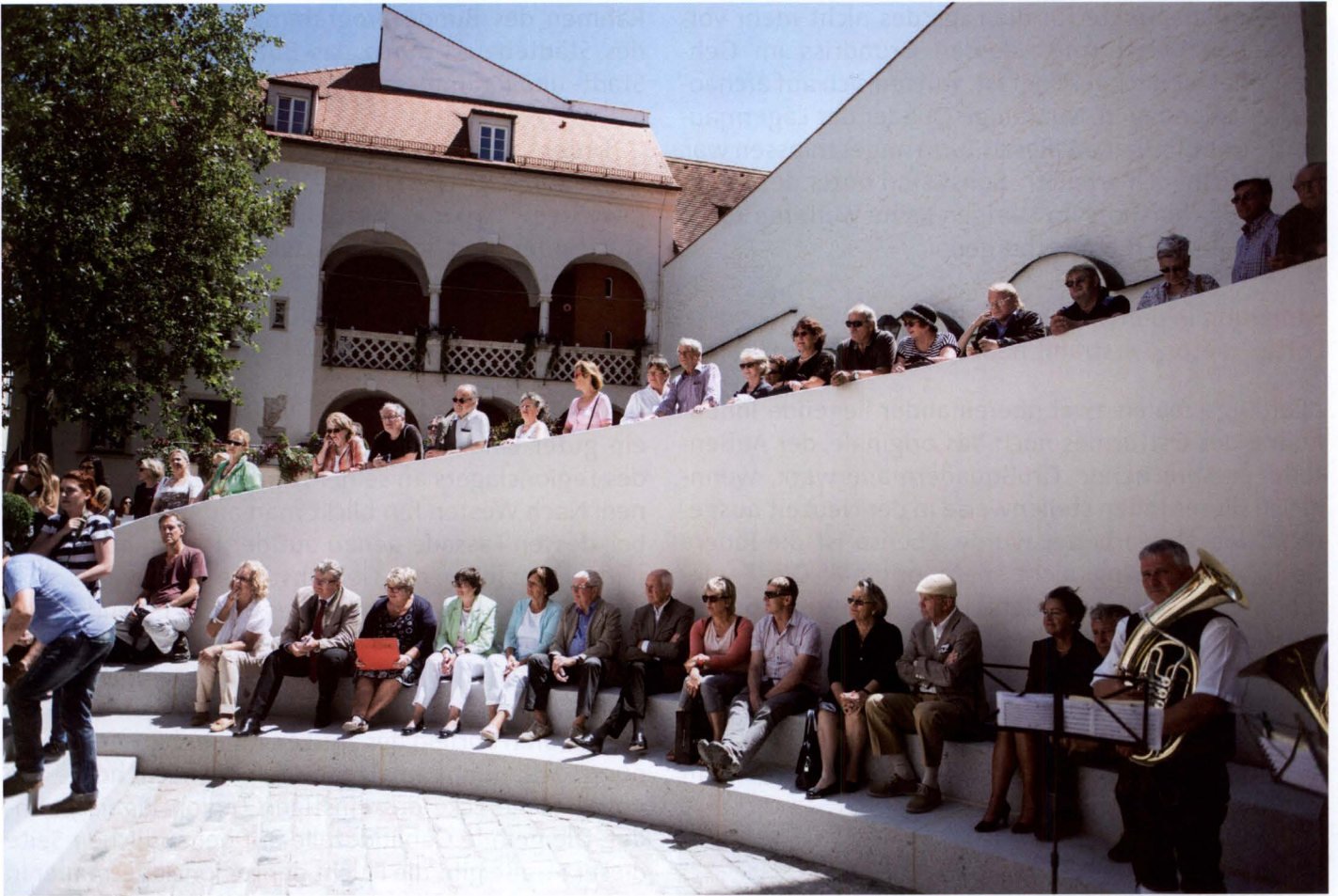
Neben dem noch erhaltenen Turm wurde eine kleine begehbare Fläche geschaffen, so dass sich etwa Touristengruppen und interessierte Besucherinnen und Besucher dort während der Führungen aufhalten können. Die Fläche wurde so gepflastert, dass sie den Verlauf und die Dimension der Mauer um das Legionslager erkennen lässt. Zwei Stufen im Halbrund der Einfahrt zum Innenhof des Hotels bieten eine Sitzmöglichkeit. Der kleine Platz wird abends beleuchtet. Auch die Porta Praetoria und der noch erhaltene Turm werden durch gezielte Beleuchtung in ihrer Bedeutung betont.

seite wurde sie ursprünglich durch einen rampenartig angeschütteten Erdwall stabilisiert. Offenbar schichtete man ihn lagenweise auf und nutzte die so entstehenden Zwischenebenen als Arbeitsplattformen für die Zurichtung der Steinblöcke für das passgenaue Einsetzen in die Vorderfront. Im Laufe der Zeit, sicherlich aber noch in der Antike, scheint diese Erdrampe hier, aber vermutlich auch auf anderen Seiten des Kastells durch eine gemörtelte Mauer aus Bruchsteinen als Hinterfüterung der Quadermauer ersetzt worden sein. Gleichzeitig mit dieser Baumaßnahme dürfte man eine Erhöhung der Mauerfront beabsichtigt haben.