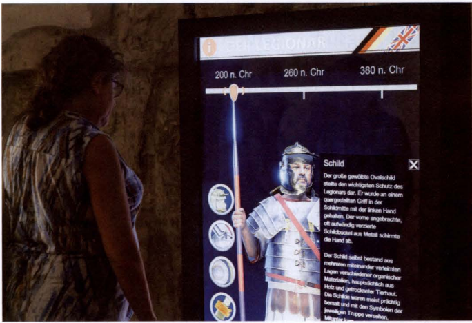
Mediale und interaktive Wissensvermittlung im „document“: Auf einem Großbildschirm ist ein „digitaler Römer“ sichtbar. Seine Ausrüstung kann angeklickt werden. So erhält man beispielsweise Informationen zur Geschichte und zur Bedeutung des Legionslagers. Die digitale Darstellung wird zukünftig auch durch einen Film erweitert.